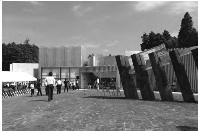
アート×ミックスの中核施設となる市原湖畔美術館

【URL】 http://www.i-cci.or.jp/ 問合せ 22-4305 グッズ担当者まで